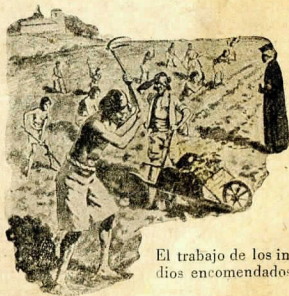
El trabajo de los indios encomendados

En vano los reyes dictaron leyes protegiéndolos, reglamentaron su trabajo dejándoles tiempo libre para el descanso y ordenaron se les pagase; era tan brutal el trato que se les daba que en Santo Domingo \frac{3}{4} partes de los indígenas sucumbieron, y